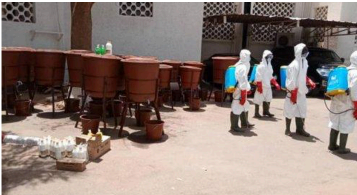
La délégation spéciale de Niamey lance une opération de lavage des mains pour sensibiliser contre le coronavirus