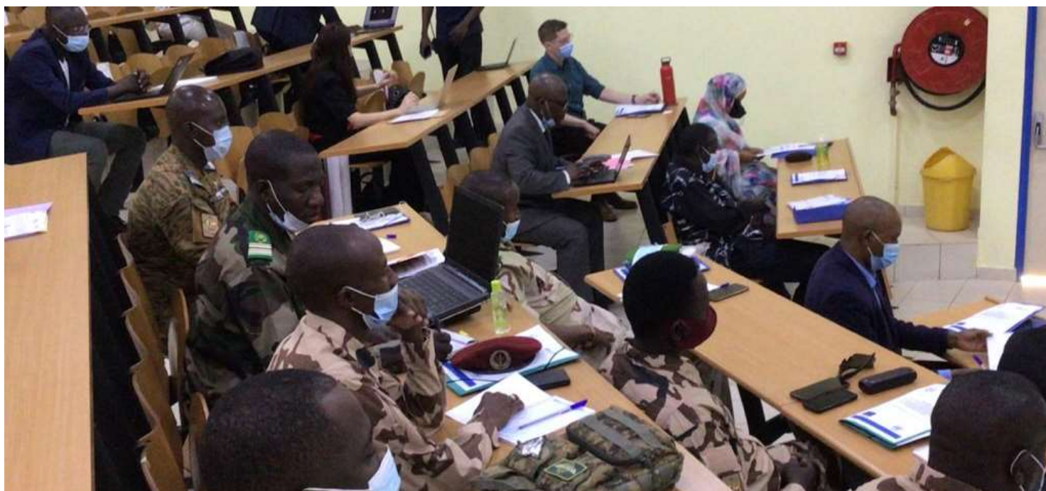
Une vue partielle des participants à la table ronde sur la prévention de l'extrémisme violent et la lutte contre le terrorisme, les 29 et 30 juin 2021 dans l'amphithéâtre de l'École de maintien de la paix à Bamako au Mali

Les 29 et 30 juin 2021, le Secrétariat exécutif et la Force conjointe du G5 Sahel, soutenus par le projet d'appui à la Force conjointe du G5 Sahel, ont réuni 18 officiers dont une femme, provenant de la Force conjointe (PCIAT, PC Fuseau et des Bataillons), afin de renforcer les capacités de ces officiers militaires, sur la prévention de l'extrémisme violent, du terrorisme et sur l'intégration et le respect des principes du DIH et du DIDH lors des opérations militaires par la Force conjointe.