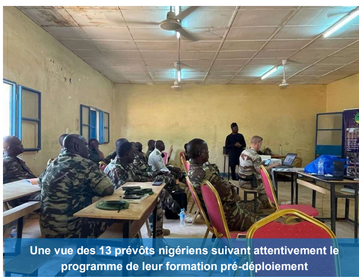
Une vue des 13 prévôts nigériens suivant attentivement le programme de leur formation pré-déploiement