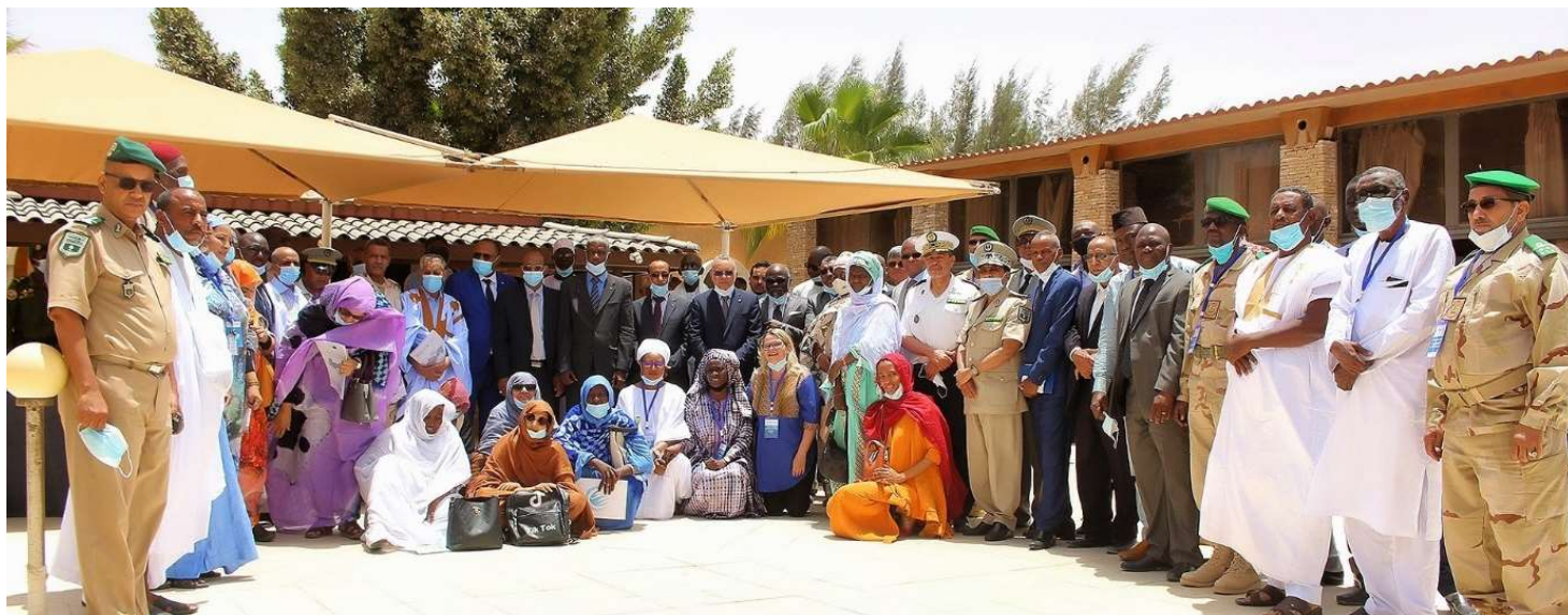
Des représentants de la Force conjointe du G5 Sahel, de la société civile mauritanienne et du HCDH posent aux côtés des autorités locales et nationales présentes à l'atelier diagnostique et de consultation sur la protection des civils, le 20 mai 2021 à Nouakchott

Dans le cadre du processus d'élaboration d'une stratégie régionale de protection des civils dans l'espace G5 Sahel, le Secrétariat exécutif du G5 Sahel (SEG5S) a organisé, en collaboration avec la FC-G5S et avec l'appui du HCDH, des ateliers diagnostics et de consultations des parties prenantes à Nouakchott en Mauritanie (du 17 au 20 mai 2021), à N'Djamena au Tchad (du 31 mai au 3 juin 2021), et à Niamey au Niger (du 22 au 25 juin 2021). Ces trois ateliers qui ont réuni au total 140 participants dont 37 femmes, interviennent après celui du Mali tenu en novembre 2020.