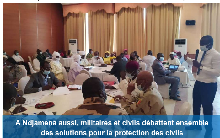
A Ndjamen aussi, militaires et civils débattent ensemble des solutions pour la protection des civils

A N'Djamena, c'est du 31 mai au 3 juin qu'ont eu lieu ces échanges entre 41 participants dont 11 femmes, représentant la Force conjointe du G5 Sahel, la Force multinationale mixte, les forces de défense et de sécurité, les autorités administratives et traditionnelles,