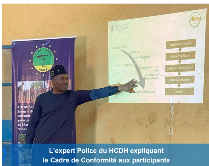
L'expert Police du HCDH expliquant le Cadre de Conformité aux participants