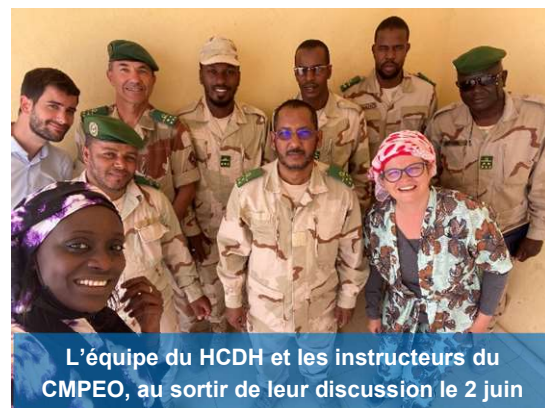
L'équipe du HCDH et les instructeurs du CMPEO, au sortir de leur discussion le 2 juin

L'équipe du Projet a aussi pu assister à un cours animé par un instructeur du CMPEO au profit de deux sections. Les techniques pédagogiques et une présentation Powerpoint ont été utilisées pour les besoins d'apprentissage des futurs soldats de la Force conjointe qui rejoindront le MAURIBAT. Ces derniers ont formulé des retours positifs sur l'exposé. La visite s'est terminée par des discussions pour l'identification des besoins pédagogiques.