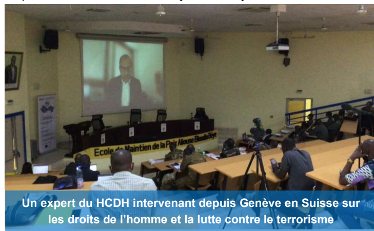
Un expert du HCDH intervenant depuis Genève en Suisse sur les droits de l'homme et la lutte contre le terrorisme

Conformément à la méthodologie choisie, chaque session a été suivie d'un large débat qui a permis aux participants de partager leurs expériences et d'apporter leurs propres contributions. Au cours de l'activité, certains participants ont souligné la centralité du terrorisme dans la question sécuritaire, souhaitant une action visant à accroître l'importance de la Force en renforçant ses moyens de contre-action.