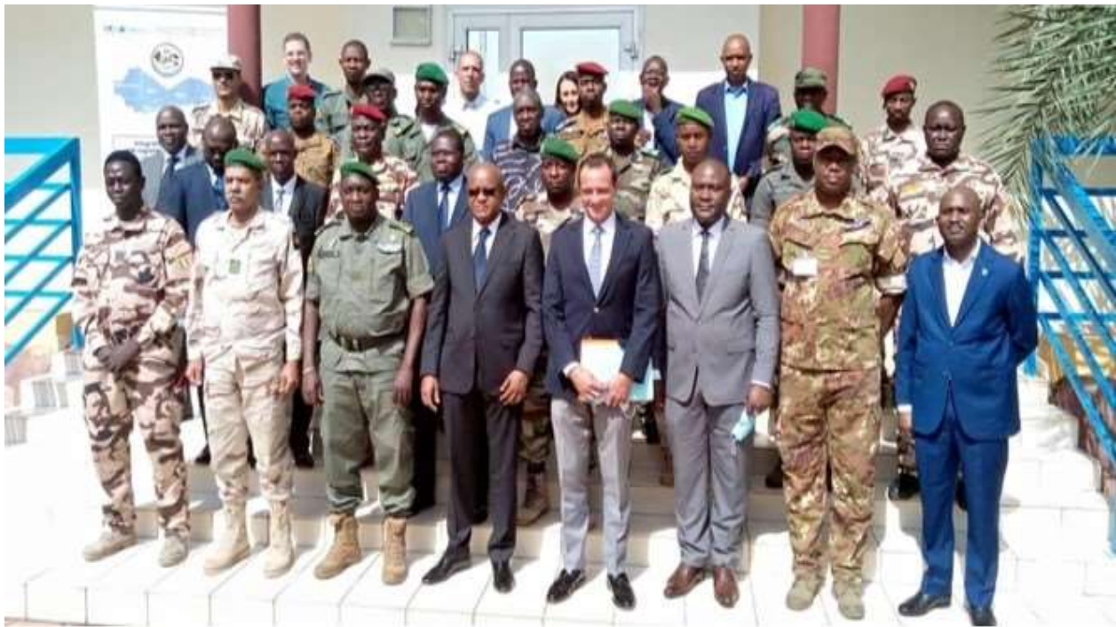
Table-ronde à BAMAKO : le respect des droits de l'homme au centre de l'action de la Force conjointe pour la prévention de l'extrémisme violent et la lutte contre le terrorisme

Bulletin d'informations N° 005 avril – juin 2021