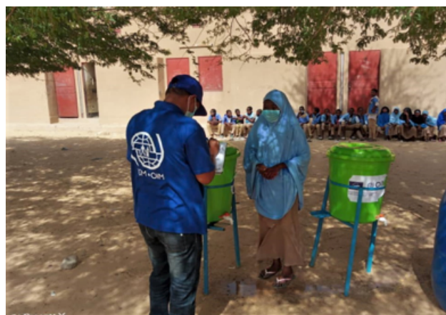
Plusieurs stations de lavage des mains et des cartons de savon ont été donnés aux écoles de la région du Kawar