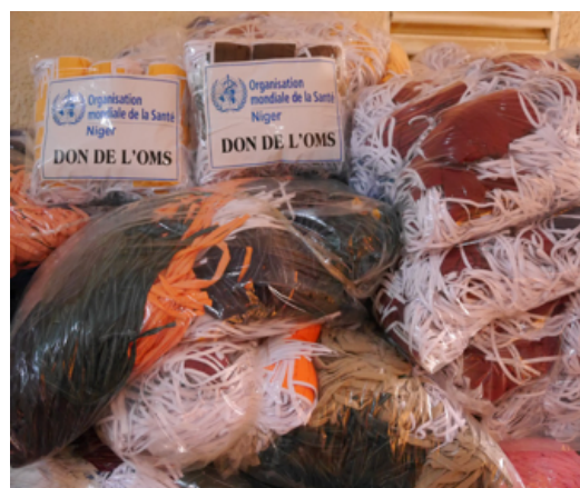
Une vue partielle des masques non médicaux produits par l'atelier