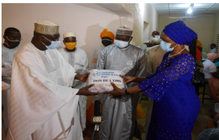
La représentante de l'OMS remettant le don au ministre de la Formation professionnelle et technique

Le pays a lancé la production locale des masques en vue d'assurer leur disponibilité pour tous dans le cadre de la lutte contre la Covid-19 et de soutenir les entreprises locales dans ce contexte difficile. Cette contribution de l'OMS vient également en aide aux ateliers de production locale et aux écoles de formation professionnelle.