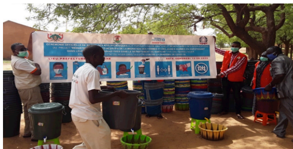
Une vue des lots de matériels pour la donation, Crédit: ONUFEMME

Financé par le Gouvernement italien à hauteur de 1.500.000 euros sur initiative ONU Femmes, le Projet, vise à renforcer les capacités économiques et productives des femmes et des jeunes hommes et également, accroître leur leadership et leur participation dans la gestion des affaires locales. La sensibilisation sur les conséquences néfastes de la migration illégale, constitue un de ses principaux axes d'intervention dans la zone.