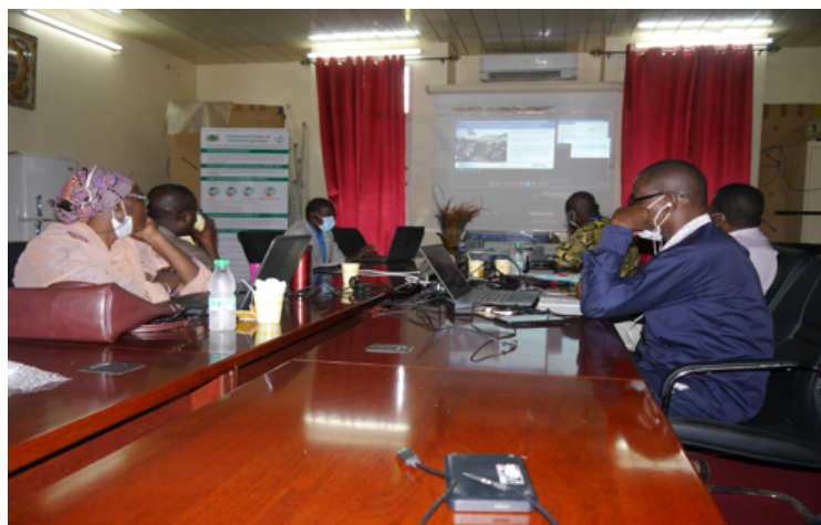
Une vue de certains membres de la commission communication pendant la formation

À la fin de la session de 3 heures de temps, la commission a recommandé d'élargir cette formation aux autres piliers de la riposte pour une meilleure compréhension et intégration de l'aspect de communication dans tous les domaines.