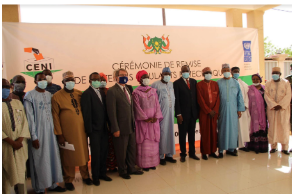
Photo de famille des participants à la cérémonie

Pour rappel, au-delà du PNUD, la coordination du SNU appuie l'inclusion et la participation des jeunes et des femmes dans le processus électoral. En effet, à travers le Projet intitulé « Création d'un environnement propice à la tenue d'élections consensuelles et paisibles en 2021 (Phase 1) financé par le PBF - Fonds pour la Consolidation de la Paix d'un montant de 2.500.000 USD mis en œuvre par UNFPA et le PNUD et leurs partenaires nationaux dont la HACB, la CENI, le CNDP, le CNDH, les audiences foraines ont permis aux jeunes et femmes d'obtenir leur pièce d'état civil et de se faire enrôler particulièrement dans 16 communes enclavées des régions de Agadez- Zinder – Maradi – et certaines populations nomades de Tillabéry.