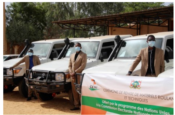
Vue partielle du matériel offert à la CENI par le PNUD / Crédit: PNUD, Niger