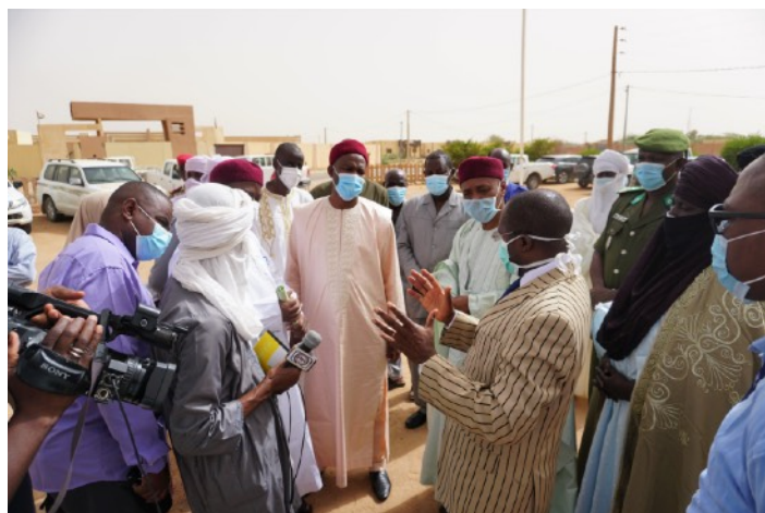
Les autorités régionales se sont réunies aujourd'hui à Agadez pour ce don effectué dans le cadre des activités de stabilisation communautaire de l'OIM

Visitez le site web des Nations Unies au Niger à l'adresse: https://niger.un.org/fr/ . Vous y trouverez des informations aussi diversifiées qu'utiles.