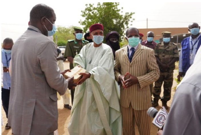
Le gouverneur d'Agadez, M. Sadou Soloke, a remercié l'OIM pour ce don généreux qui aidera le gouvernement dans la lutte contre le COVID-19

Au nombre des articles donnés par l'OIM avec le soutien de l'Union Européenne au Niger, des stations de lavage des mains, du savon, du matériel de sensibilisation, et du désinfectant pour les mains produit localement par les étudiants de l'Université d'Agadez.