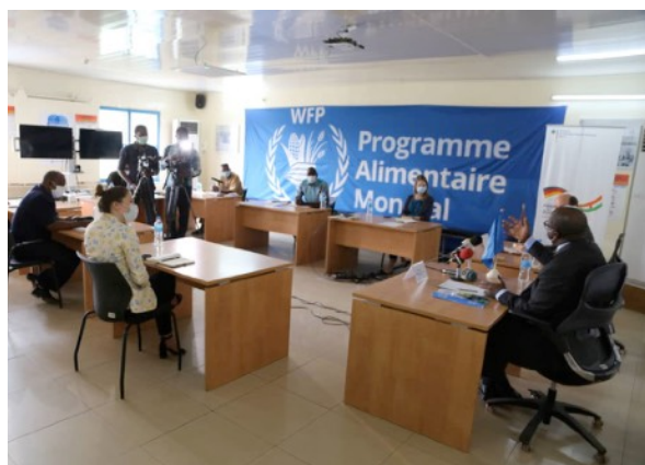
Une vue de la conférence de presse sur l'appui de l'Allemagne au programme de résilience