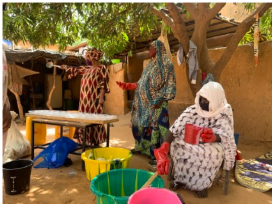
Des femmes réfugiées fabriquent du savon dans une savonnerie à Niamey, au Niger

Retrouvez l'intégralité de l'article ici