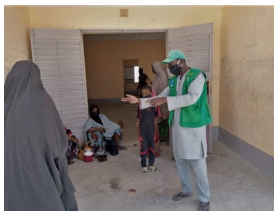
Les Mobilisateurs Communautaires de l'OIM en pleine sensibilisation à Dirkou