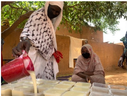
Des femmes réfugiées versent du savon dans les moules, dans une savonnerie à Niamey, au Niger

Depuis l'apparition de la pandémie de coronavirus, ce petit projet d'entraide est devenu une fabrique qui produit du savon liquide, du gel hydro alcoolique pour le lavage des mains, de l'eau de javel et des récipients d'eau à distribuer gratuitement. Le projet a été créé en 2019 par le HCR et l'association locale à but non lucratif « Forge Arts, », dans un centre de transit d'urgence (ETM) à Hamdallaye, une petite localité située à moins de 100 kilomètres de Niamey.