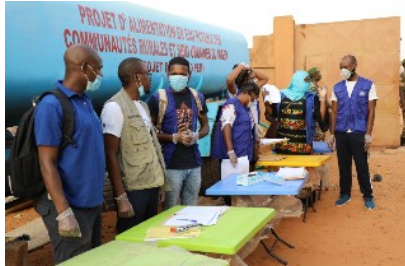
Le personnel de l'OIM à Niamey a assisté le groupe à son départ vers les lieux d'origine