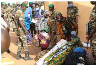
Les 1 400 ressortissants nigériens qui étaient en quarantaine depuis deux semaines après leur retour du Burkina Faso, ont quitté le site le 16 mai