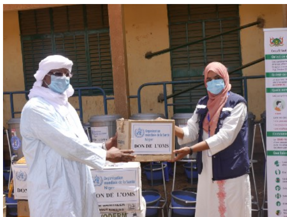
Remise symbolique du lot au Secrétaire Général du Ministère des enseignements secondaires par la Chargée de Programme Santé Mère, Enfant, Jeunes et Adolescents de l'OMS/ Crédit: OMS