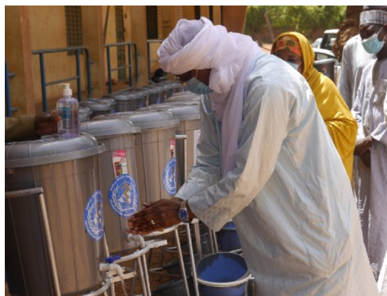
Le Secrétaire Général se lavant les mains avec un des kits offerts

Visitez le site web des Nations Unies au Niger à l'adresse: https://niger.un.org/fr/ . Vous y trouverez des informations aussi diversifiées qu'utiles.