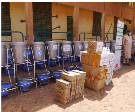
Une vue partielle du matériel offert

C'est pour apporter son appui à ce comité que l'OMS a décidé d'apporter son soutien au Ministère des Enseignements Secondaires en contribuant à la mise en place du matériel pour le respect des gestes barrières contre le Covid-19.