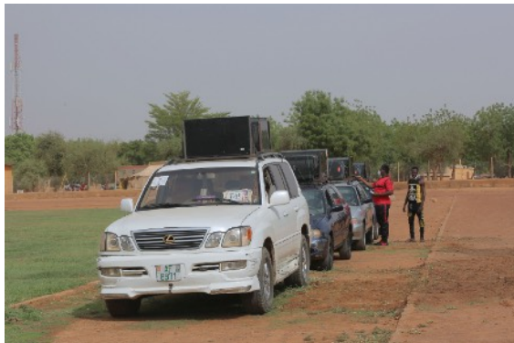
Une vue partielle de la caravane avec les véhicules sonorisés

L'appui de l'OMS porte sur la production de supports de sensibilisation, ainsi que le financement de la mise en œuvre des activités de sensibilisation dans 10 camps pour passer les messages sur la lutte contre le covid-19, ce qui contribuera certainement à renforcer la protection des familles des forces de défense et de sécurité.