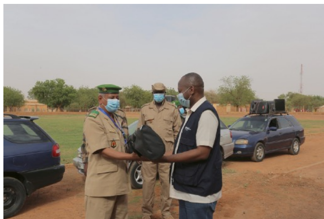
Le Représentant du Chef des Etats Majors de l'armée recevant symboliquement les supports de l'OMS

Visitez le site web des Nations Unies au Niger à l'adresse: https://niger.un.org/fr/ . Vous y trouverez des informations aussi diversifiées qu'utiles.