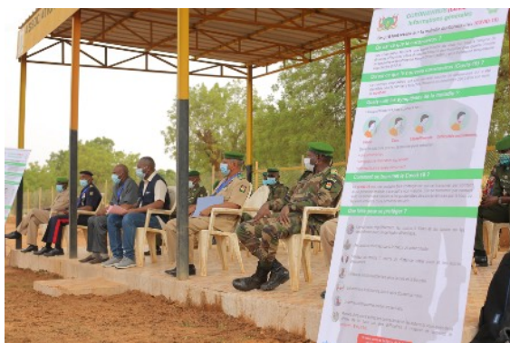
Une vue des officiels au lancement