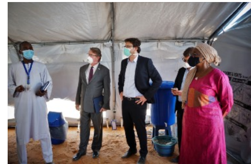
Visite du site humanitaire aménagé pour l'assistance sanitaire des migrants nigériens isolés en quarantaine sur le site

Visitez le site web des Nations Unies au Niger à l'adresse: https://niger.un.org/fr . Vous y trouverez des informations aussi diversifiées qu'utiles.